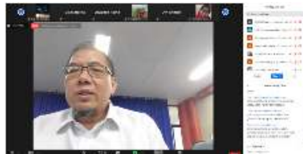
Gambar 10. Tanya jawab peserta webinar