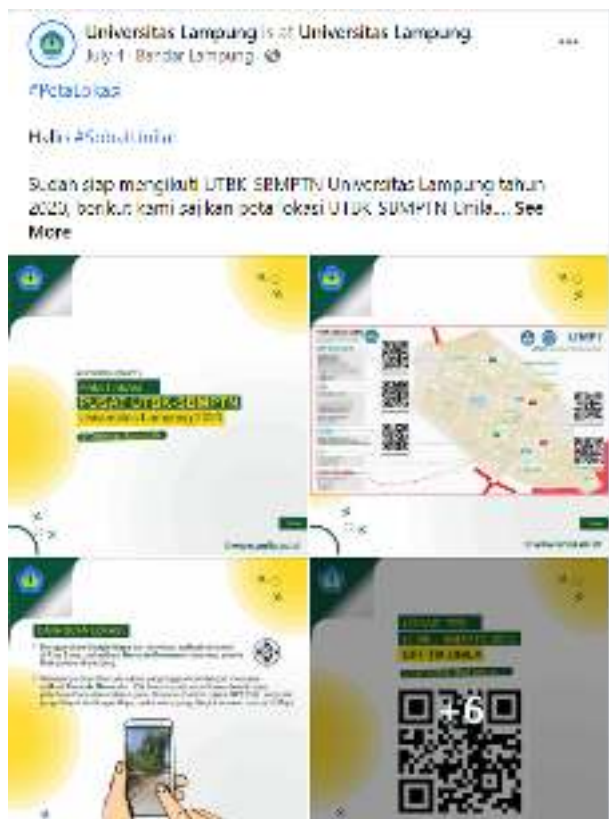
Gambar 4. Banner informasi UTBK pada medsos Unila