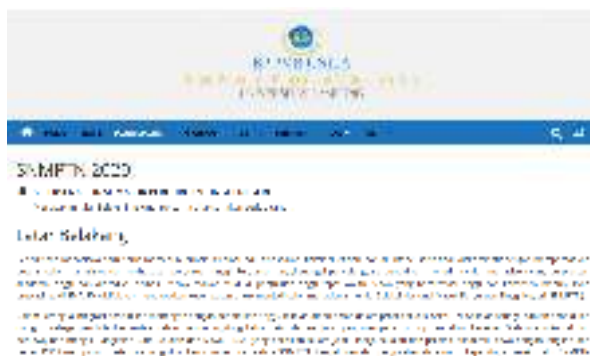
Gambar 1. Materi sosialisasi dan promosi pada website

Kegiatan ini dilakukan dengan membuat dan mengupdate konten sosialisasi dan promosi penerimaan mahasiswa baru pada media website yang dimiliki Unila yakni http://simanila.unila.ac.id dan http://www.unila.ac.id . Kedua website tersebut merupakan website utama yang digunakan Unila untuk memberikan informasi terkait penerimaan mahasiswa baru yang dilaksanakan oleh Unila tiap tahunnya. Informasi yang ditampilkan akan diperbaharui secara berkala mengikuti jadwal yang sudah ditetapkan. Contoh informasi pada website ditampilkan pada gambar 1.