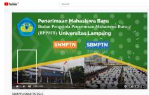
Gambar 5. Video jalur SNMPTN dan SBMPTN

audio dan visual yang bisa dimanfaatkan oleh calon peserta mendapatkan informasi lebih detail tentang proses penerimaan mahasiswa baru. Video yang sudah dibuat kemudian diupload pada kanal media sosial youtube agar dapat dilihat oleh para khalayak ramai. Gambar 5 menampilkan video jalur SNMPTN dan SBMPTN, video dapat diakses pada tautan https://www.youtube.com/watch?v=MnX6dEhfwYY .