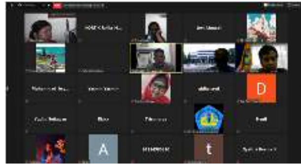
Gambar 9. Peserta webinar