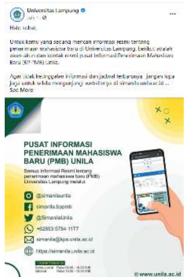
Gambar 2. Konten medsos pusat informasi PMB Unila

generasi milenial yang menjadi target sasaran informasi lebih banyak menggunakan media sosial. Gambar 2 menampilkan informasi tentang channel pusat informasi penerimaan mahasiswa baru Unila yang bisa dihubungi oleh siswa.