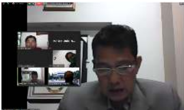
Gambar 8. Pembukaan webinar oleh Wakil Rektor Bidang Akademik Unila

Gambar 8 menampilkan kegiatan webinar yang dibuka secara daring oleh Wakil Rektor Bidang Akademik Unila. Gambar 9 menampilkan beberapa peserta yang mengikuti webinar secara daring. Dengan metode sinkronus maka peserta dapat berinteraksi secara langsung dengan pemberi materi. Gambar 10 menampilkan beberapa peserta yang bertanya langsung melalui kolom chat yang telah disediakan.