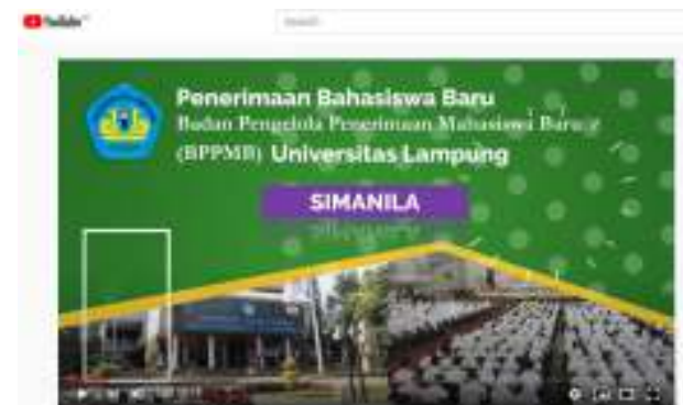
Gambar 6. Video jalur mandiri/Simanila

Gambar 6 menampilkan video jalur mandiri atau Simanila yang dilaksanakan oleh Unila. Video dapat dilihat pada laman https://www.youtube.com/watch?v=wRhjS8DQ6_o . Jalur ini terdiri dari beberapa program yakni Seleksi Mandiri Masuk Perguruan Tinggi Negeri Kawasan Barat (SMMPTN Barat) yang merupakan seleksi mandiri bersama beberapa PTN yang menjadi anggota Badan Kerjasama PTN (BKS PTN) wilayah Barat, PMPAP, Prestasi Khusus dan Kelas Internasional pada Fakultas Ekonomi dan Bisnis. Selain video tersebut juga terdapat beberapa video sosialisasi lebih detail terkait prosedur pendaftaran setiap jalur penerimaan yang dibuat dan dipublikasikan oleh tim sosialisasi dan promosi.