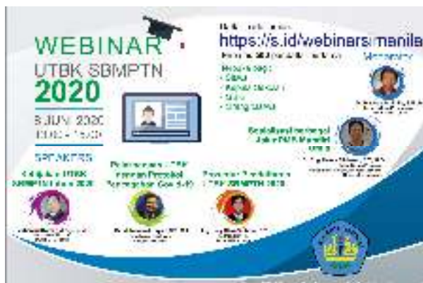
Gambar 7. Flyer seri webinar PMB Unila

Webinar dilakukan sebagai sarana sosialisasi yang lebih interaktif bagi calon peserta, orang tua, guru dan kepala sekolah untuk mendapatkan informasi lebih jelas. Peserta dibatasi bagi 500 orang pendaftar pertama dan dilaksanakan dengan media aplikasi Zoom. Peserta diminta melakukan registrasi terlebih dahulu pada link yang sudah disediakan oleh panitia. Kegiatan webinar series dilakukan sebanyak beberapa kali sesuai dengan jadwal penerimaan mahasiswa baru yang akan berlangsung. Gambar 7 menampilkan flyer informasi webinar yang akan diselenggarakan.