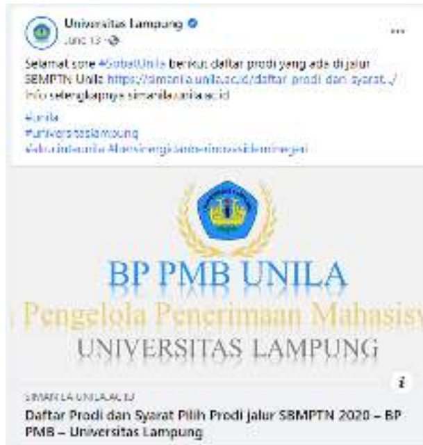
Gambar 3. Informasi program studi di Unila