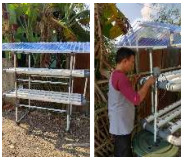
Gambar 4. Pemasangan Hidroponik Kit dan Saluran Irigasi

Komponen lain yang digunakan untuk hidroponik adalah netpot, rockwall dan timer. Netpot digunakan sebagai pot kecil berjaring, rockwall untuk penanaman dan timer untuk mengatur waktu pengairannya.