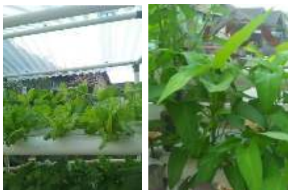
Gambar 9. Tanaman telah siap dipanen

Pemanenan dilakukan setelah tanaman cukup umurnya (Gambar 9). Untuk jenis tanaman bayam, kangkung, caisim, pakcoy, bayam merah maupun selada umur pemanenan sekitar 1 bulan. Di akhir Agustus 2019 telah dilakukan pemanenan pertama dari pertanian hidroponik di TPQ Darrul Islam..