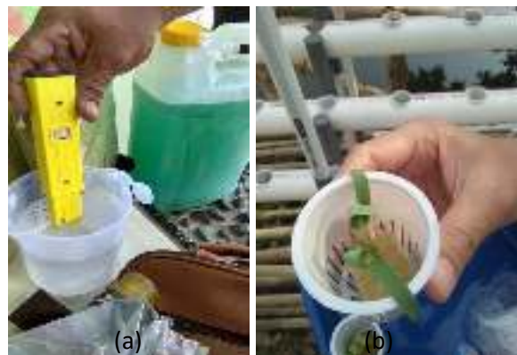
Gambar 7. (a) Pengecekan pH air hidroponik dan (b) Pengecekan pertumbuhan tanaman

Pengecekan kualitas air irigasi dilakukan untuk mengetahui pH dan TDS air yang mengalir di hidroponik, kecukupan air yang mengalir, tanaman apakah terpapar panas pagi yang cukup dan tidak terpapar panas sore yang berlebihan, serta kondisi pertumbuhan tanaman.