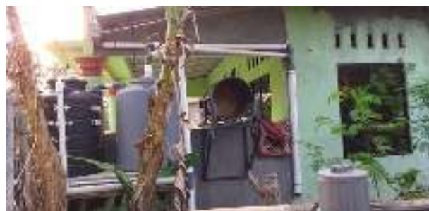
Gambar 2. Tampak samping sistem Pemanenan Air Hujan (PAH)

Pada saat ini sedang musim kemarau dan hujan sudah lama tidak turun. Jika nanti hujan turun, maka seminggu pertama air hujan tidak diperkenankan untuk masuk ke tangki air. Karena hujan seminggu pertama dianggap menyapu udara atau atmosfer yang terkena polusi maupun hujan asam. Setelah seminggu maka air hujan dapat dipanen menggunakan PAH.