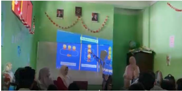
Gambar 4. Pembelajaran Berbasis Multimedia menggunakan Proyektor

di SD Swasta Al Ma'arif Medan yang dapat dilihat pada Gambar 4.