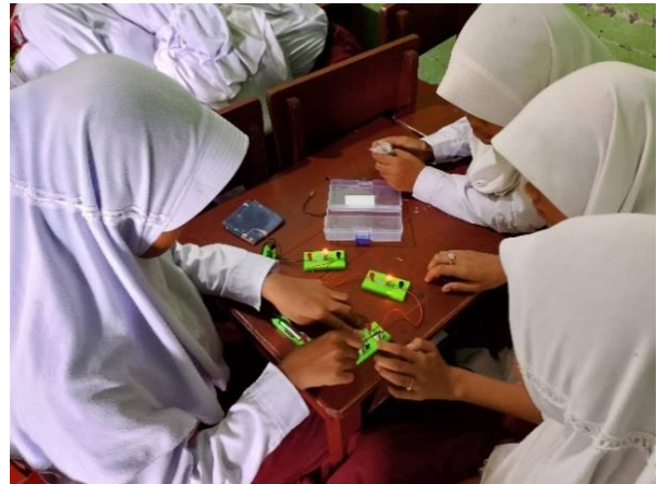
Gambar 6. Percobaan rangkaian Listrik oleh siswa