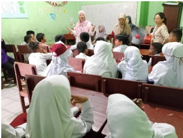
Gambar 5. Pelatihan Rangkaian Listrik

Tim PKM memberikan pelatihan eksperimen sederhana mengenai rangkaian listrik kepada para siswa. Pelatihan diawali dengan pemberian materi mengenai pengenalan rangkaian listrik dan memberikan rekaman video pembelajaran interaktif mengenai eksperimen rangkaian listrik sebagai contoh bagi guru kemudian dilanjutkan dengan membagi siswa dalam 5 kelompok untuk melakukan percobaan secara langsung menggunakan Kit eksperimen rangkaian listrik seri dan paralel. Proses pelatihan dapat dilihat pada Gambar 5 dan pada Gambar 6 dapat dilihat proses percobaan yang dilakukan oleh siswa.