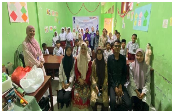
Gambar 2. Kegiatan PKM

terlibat adalah dosen dari Program Studi DIII Teknik Telekomunikasi, DIV Teknologi Rekayasa Jaringan Telekomunikasi serta mahasiswa Politeknik Negeri Medan. Dokumentasi kegiatan dapat dilihat pada Gambar 2.