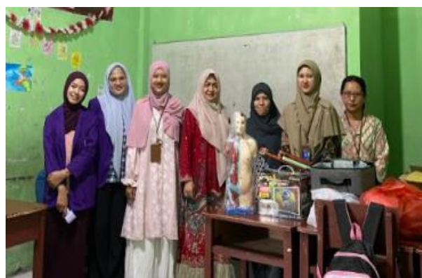
Gambar 3. Penyerahan Alat Peraga IPA

Para guru dapat menjelaskan materi IPA yang berkaitan dengan anatomi tubuh menjadi lebih menarik sehingga meningkatkan minat siswa dalam belajar dengan adanya alat peraga Anatomi tubuh manusia. Penyerahan alat peraga IPA kepada guru SD Swasta Al Ma'arif Medan diperlihatkan pada Gambar 3.