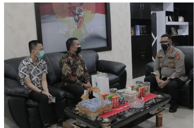
Gambar 2. Tim Unila dan Kapolres Way Kanan