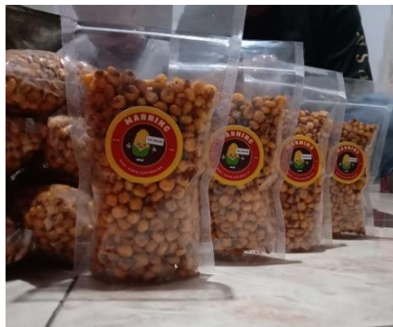
Gambar 4. Inovasi kemasan produk