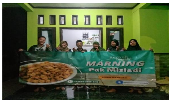
Gambar 5. Pemasangan banner