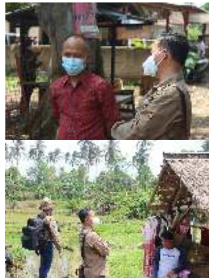
Gambar 2. FGD pemetaan partisipatif terkait pemetaan obyek geowisata mata air way bekhak

Konservasi secara sederhana diartikan sebagai upaya untuk memelihara apa yang kita miliki (sumberdaya alam). Konservasi menurut Randall (1982) merupakan alokasi sumberdaya antar-waktu yang optimal secara social. Secara umum konservasi merupakan pengelolaan sumberdaya secara bijaksana untuk menjamin kesinambungan persediaannya dengan tetap memelihara dan meningkatkan kualitas nilai. Partisipasi aktif dari masyarakat merupakan kunci keberhasilan dari konservasi. Partisipasi merupakan keterlibatan aktif dan bermakna dari masyarakat pada tingkatan-tingkatan yang berbeda di dalam proses pembentukan keputusan untuk menentukan tujuan-tujuan kemasyarakatan dan pengalokasian sumber-sumber untuk mencapai tujuan yang diinginkan.