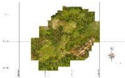
Gambar 3. Hasil pemetaan partisipatif masyarakat tentang obyek geowisata mata air way bekhak

pelestarian mata air sangat dipengaruhi oleh perbedaan pengetahuan masyarakat tentang mata air tersebut. Semakin tinggi tingkat pengetahuan masyarakat tentang pelaksanaan dan manfaat mata air, maka semakin tinggi tingkat partisipasi dalam pelestarian mata air.