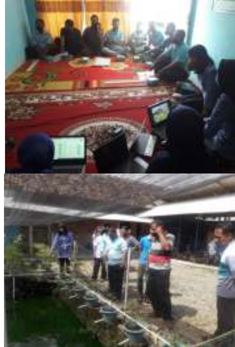
Gambar 4. Sosialisasi diseminator kepada kelompok mitra “Mandiri Sentosa” dan Persiapan Perlengkapan

pertemuan kelompok pembudidaya yang terlibat dalam kegiatan ini. Kelompok pembudidaya tersebut merupakan kelompok yang menjadi mitra (Gambar 4).