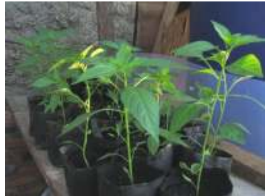
Gambar 6. Penyemaian benih sayuran di polybag

karena pada teknologi akuaponik ini mengutamakan hasil panen berupa sayuran organik maka sayuran tidak perlu diberi pupuk dan juga tidak menggunakan pestisida. Guna mencegah timbulnya hama pada tanaman, maka disiasati dengan penyelingan jenis tanaman. Selama pemeliharaan dan perawatan dilakukan pendampingan dan monitoring.