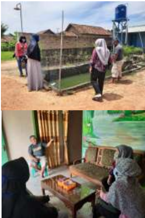
Gambar 3. Survei lokasi pengabdian kepada masyarakat dan sosialisasi dan penyuluhan mengenai teknologi akuaponik kepada mitra.

Data hasil observasi lapang yang berhasil dikumpulkan dianalisis kembali untuk menyusun program kerja dan jadwal kegiatan. Program kerja dan jadwal kegiatan dikonsultasikan kepada masyarakat. Umpan balik dari masyarakat digunakan untuk memperbaiki rencana program kerja sehingga sesuai dengan keinginan masyarakat. Observasi lapangan dilakukan agar dalam penerapan teknik akuaponik dapat sesuai dengan kondisi lapang yang ada (Gambar 3).