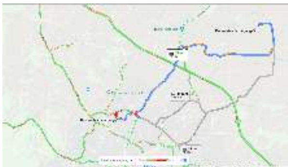
Gambar 1. Peta Lokasi Kegiatan

Lokasi kegiatan Diseminasi Ikan dan sayur organik melalui Teknologi Akuaponik berada di Kecamatan Jati Agung, Kabupaten Lampung Selatan, Provinsi Lampung (Gambar 1.). Kegiatan ini dilakukan selama 7 bulan sejak April sampai Oktober 2020 yang melibatkan mitra dari kelompok tani Mandiri Sentosa, Dosen dan tenaga ahli Jurusan Perikanan dan Kelautan Universitas Lampung. Selain itu, kegiatan ini melibatkan ibu-ibu rumah tangga pada saat proses pasca produksi.