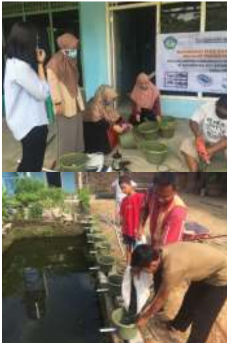
Gambar 5. Persiapan instalasi akuaponik bersama anggota kelompok “Mandiri Sentosa” dan Penanaman sayuran

kelapa, batu kerikil dan arang Air yang telah dilewatkan ke media penanaman sayuran (dimana kandungan nitrogen berkurang karena telah dimanfaatkan oleh sayuran) akan dikembalikan ke dalam kolam budidaya ikan. Hal yang perlu diperhatikan pada teknologi akuaponik ini adalah mempertahankan sirkulasi air tetap berjalan dengan lancar.